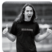
写真家 イルコ・アレクサンダロフ